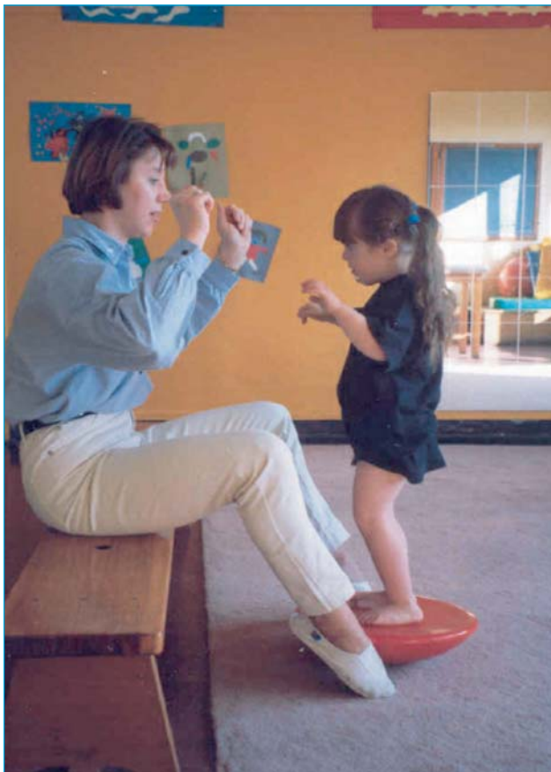
Figure 2. Rééducation portant sur la tonification, la statique, la proprioception, l'équilibre et la coordination.

Il est important de surveiller la statique de l'enfant (courbures vertébrales accentuées, épaules enroulées, scoliose), afin d'en limiter l'évolution ou de proposer d'autres traitements.